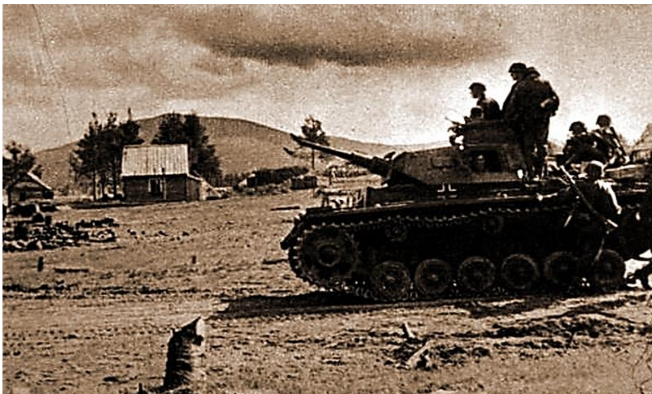
Pz.Kpfw.III 40-го танкового батальона особого назначения