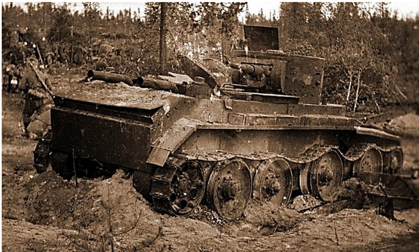
Сгоревший советский танк БТ-7

планирующееся советское контрнаступление в районе горы Кейнувара — подразделения 1-й тд не только не смогли дойти до 122-й сд, но и понесли потери в материальной части. На этом оборонительный потенциал 122-й сд иссяк окончательно.