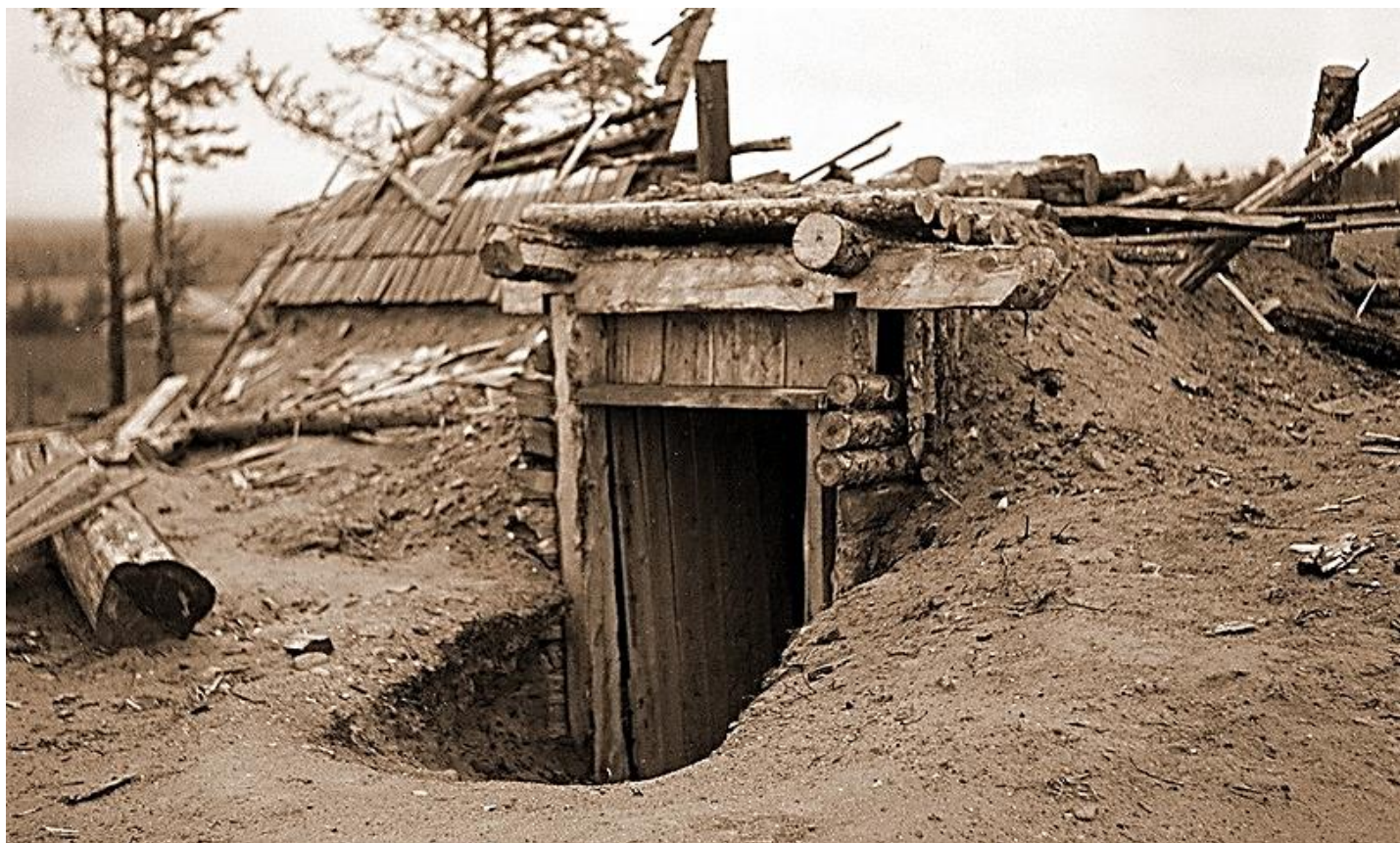
Уничтоженный артобстрелом или бомбёжкой с воздуха советский блиндаж

1 июля в 16:00 началась артподготовка и мощный авианалёт на советские позиции. Через 20 минут начали выдвигаться сухопутные силы. Хотя им удалось сбить советское передовое охранение, практически сразу начались проблемы — в первые же часы наступления была потеряна связь с дивизией СС «Норд», в полосе наступления 169-й пд продвижение прекратилось. К вечеру была предпринята попытка бросить в бой танки 2-й роты 40-го тб, однако эта атака не удалась — более того, машины застряли в болоте. Тем временем СС «Норд» оказалась в сложном положении: часть наступающих подразделений попала под постоянный обстрел и не могла отойти для перегруппировки.