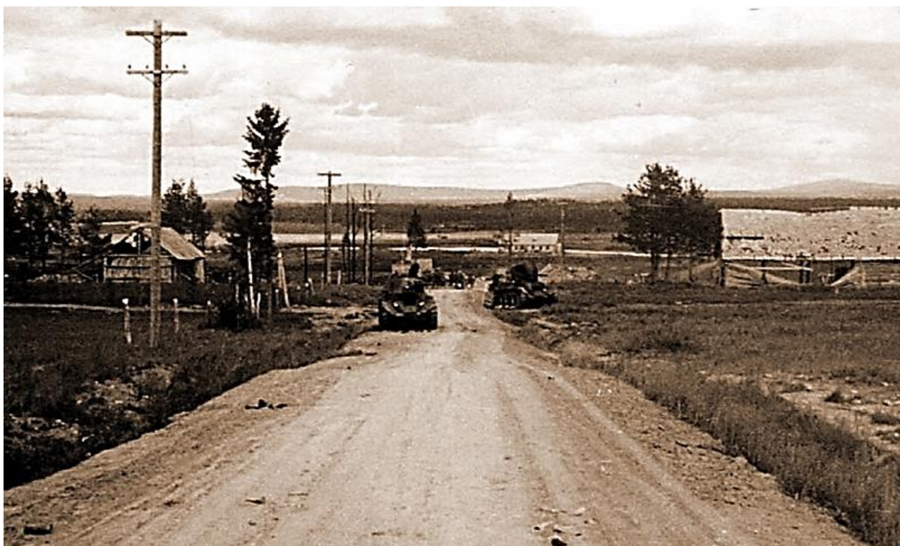
Дорога на Куоляярви с брошенными на обочине и сгоревшими советскими танками

Укрупнение группировки в результате отступления позволяло выделять больше подразделений на опасные участки вражеского наступления, а также иметь большой резерв. Таким образом, решение отвести дивизию стало верным и своевременным решением. Вместе с тем, качество исполнения этого решения оказалось невысоким. Фактически приказ на отход давался постфактум, а само отступление проходило буквально в панических условиях, в большей степени неорганизованно, более того — дивизия потеряла часть тяжёлого вооружения. Ещё больший вред нанесло оставление противнику батальоном связи 122-й сд секретной документации. Так закончилось июльское сражение за Куоляярви. Оно имело несколько аспектов.