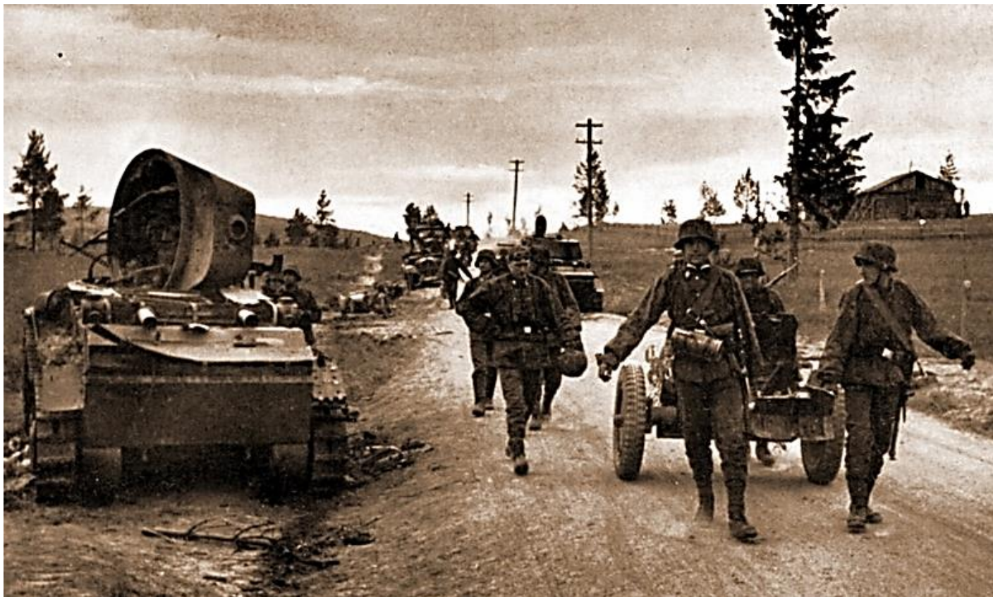
Солдаты дивизии СС «Норд» в Заполярье идут мимо разбитого БТ-7, лето 1941 года

Изначально именно удар дивизии СС «Норд» намечался как главный, однако по результатам совещаний и анализа боеготовности соединения к концу июня командование XXXVI армейского корпуса настаивало на фланговой атаке 169-й пд как основной. Это создало конфликт с командованием армии «Норвегия», считавшей дивизию СС «Норд» вполне подходящей для главной роли в наступлении. В итоге главный удар наносила всё же 169-я пд.