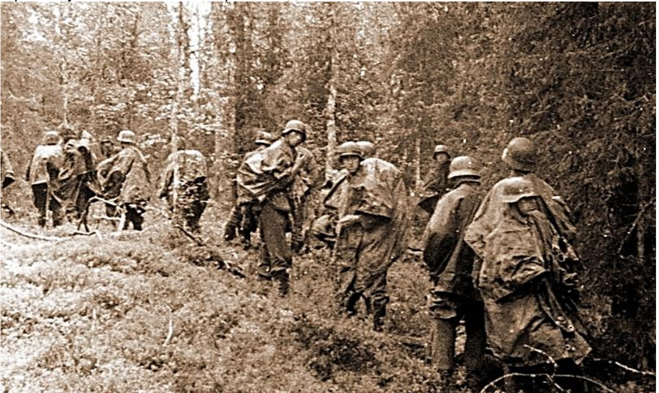
Солдаты 169-й пехотной дивизии вермахта, лето 1941 года