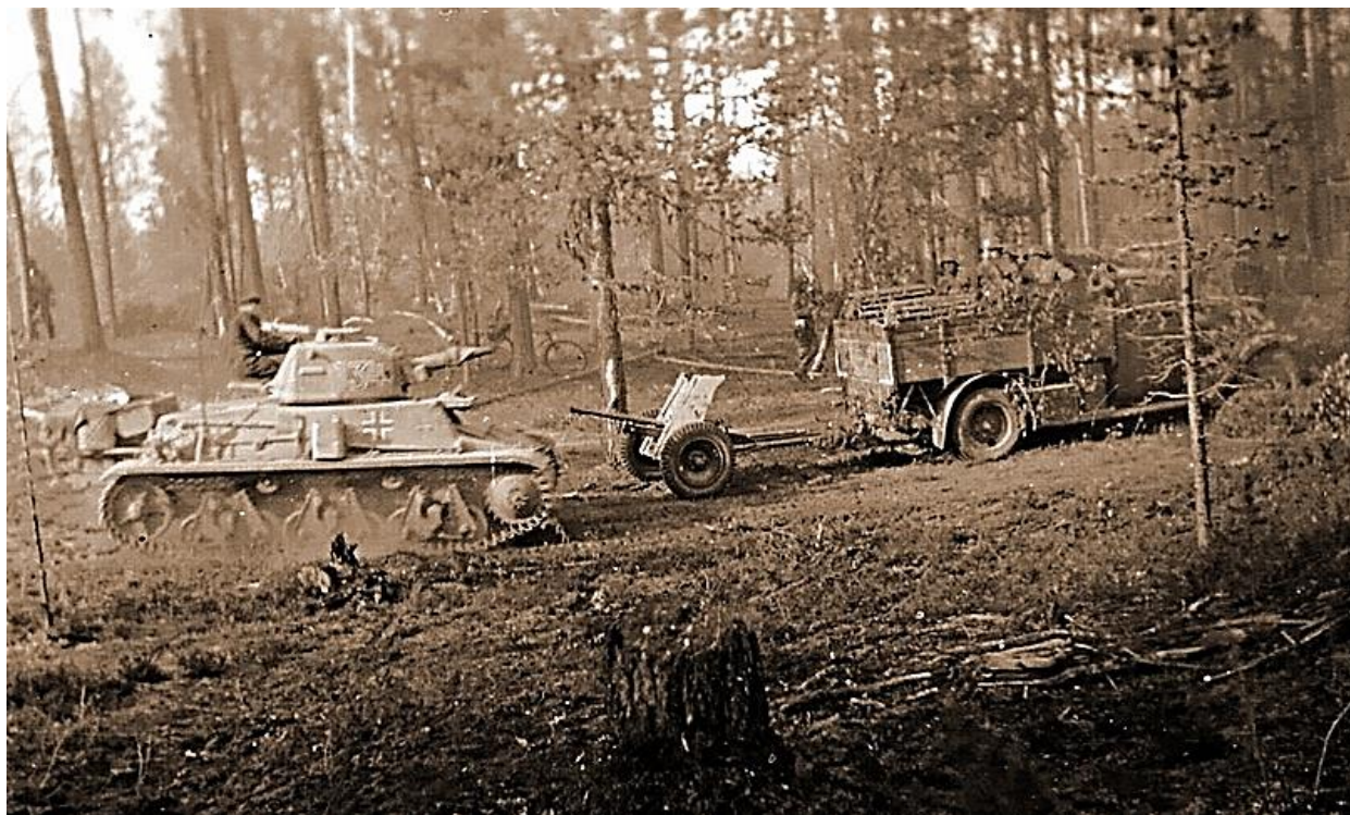
«Гочкисс» из состава 211-го танкового батальона вермахта

участках фронта: 1-я рота действовала на мурманском направлении и поддерживала горнострелковые дивизии, 3-я рота была прикреплена к финскому III армейскому корпусу. Батальон был вооружён немецкими танками. Основой стали Pz.Kpfw.III с 37-мм и 50-мм пушками, полученные незадолго до начала операции, но имелись и лёгкие Pz.Kpfw.I и Pz.Kpfw.II. Имелись проблемы с подготовкой экипажей — в то время как Pz.Kpfw.III были укомплектованы обученными экипажами, остальные танки обслуживались малоопытным персоналом.