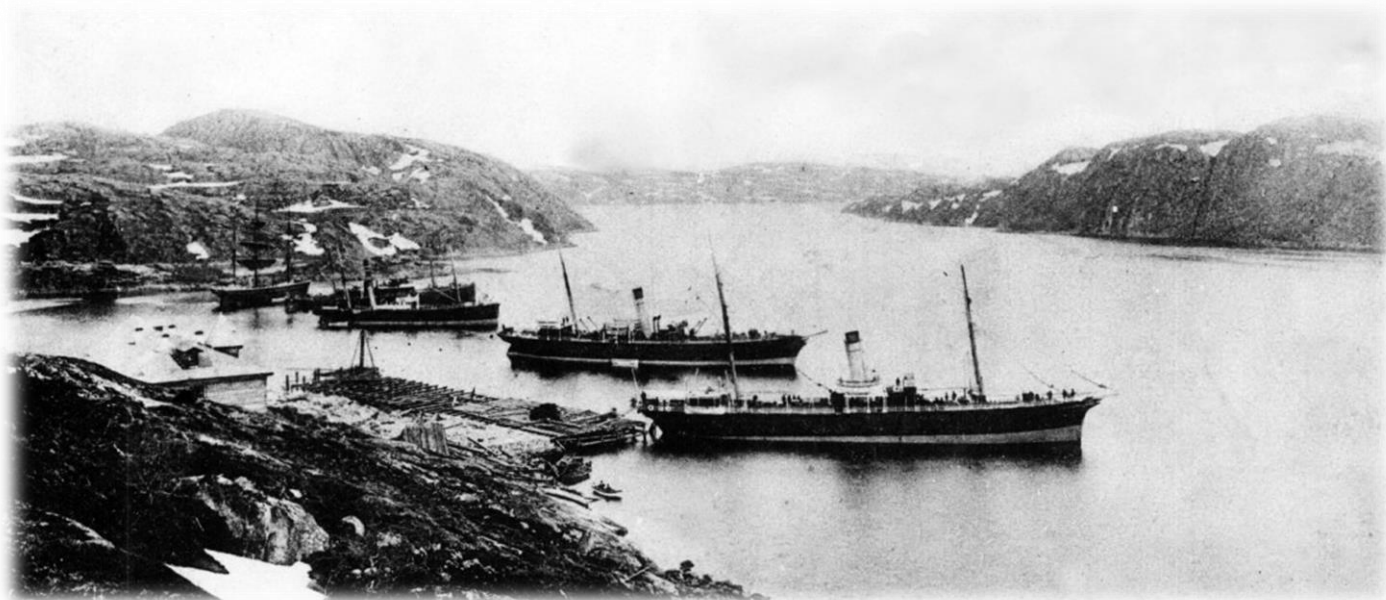
г. Александровск. Екатерининская гавань (1899 г.)

В 1918–1920 годах Александровский уезд вошёл в состав Мурманского края и Северной области.