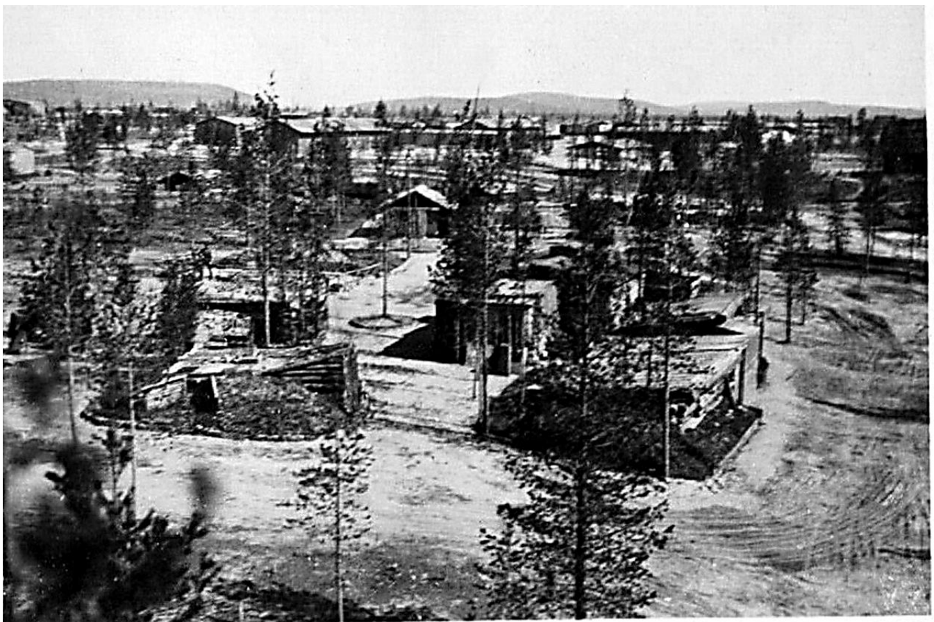
Село Алакуртти в 1943 году