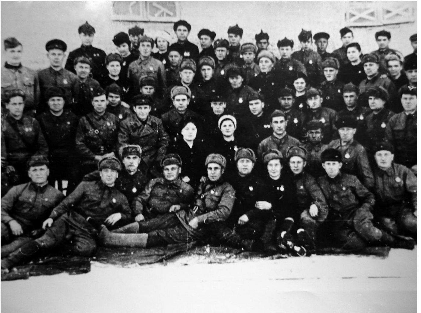
Партизанский отряд после успешного выполнения задания