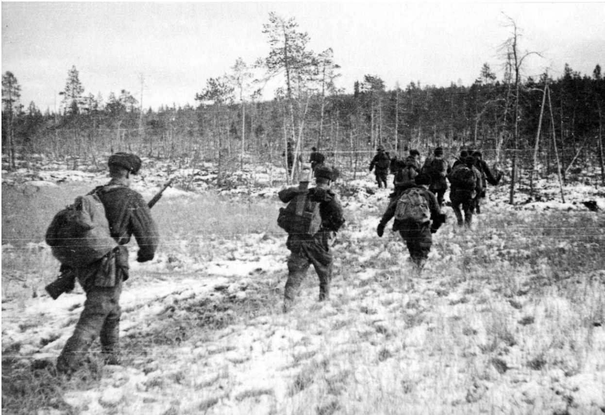
Отряд на задании