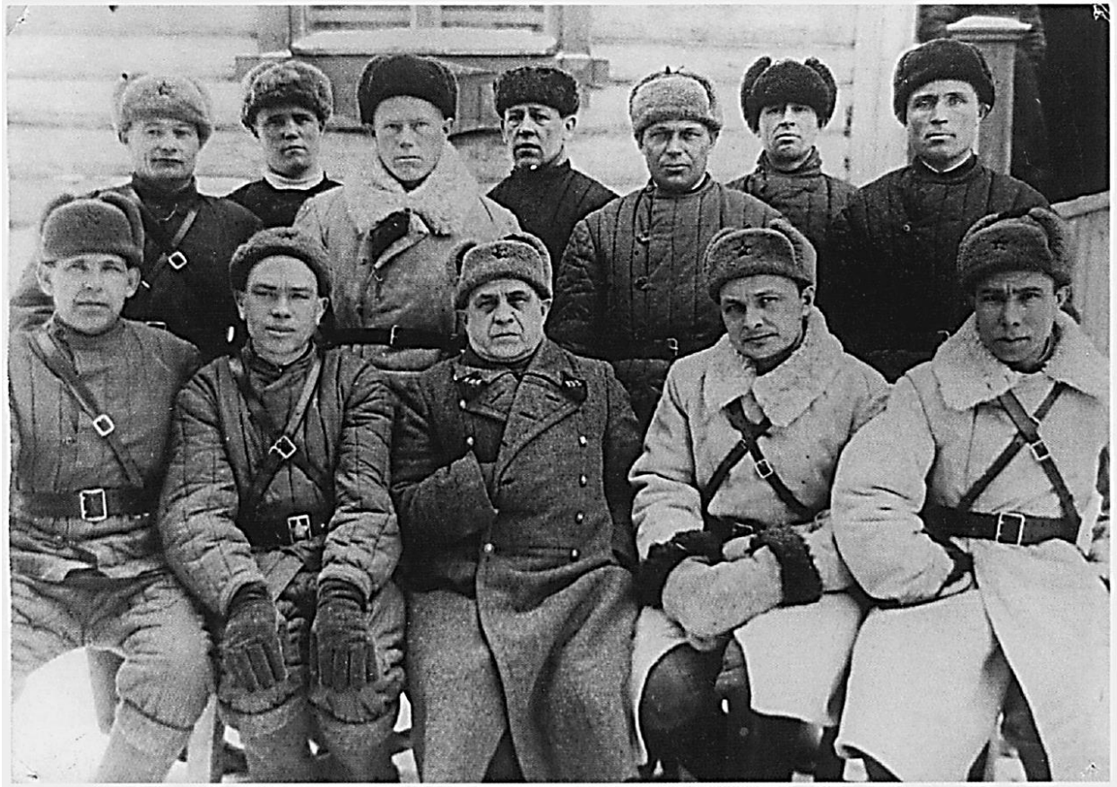
Партизанский отряд «Полярник»