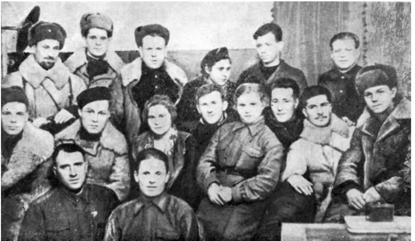
Группа партизан из отряда «Большевик Заполярья»