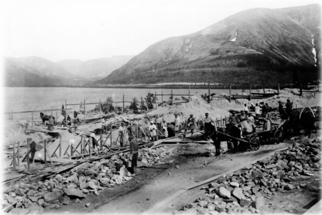
Хибиногорск. Строительство электростанции на берегу озера Большой Вудъявр.

В октябре 1940 года был организован Заимандровский ИТЛ (Заимандровское строительство и ИТЛ Заимандровлаг), располагавшийся на станции Оленья Кировской железной дороги. Был предназначен для строительства Заимандровского железного рудника. Первая партия заключённых прибыла в феврале 1941 года, наибольшая численность составляла 1349 человек.