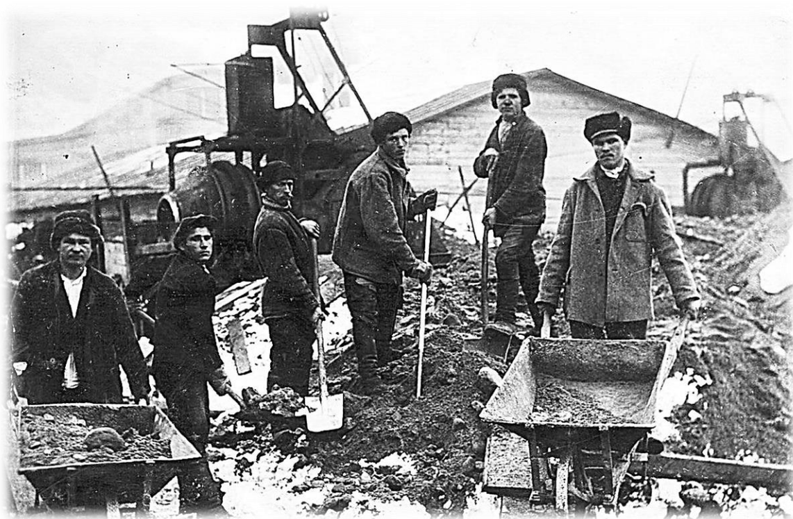
Строители г. Хибиногорска (Кировска)

Белореченский ИТЛ (Белречлаг, Кировскстрой) был организован 03.08.1951 г., закрыт 20.07.1953 г. Располагался в районе станции Апатиты и предназначался для строительства Кировского химического завода и города Кировска, выполнения дорожно-строительных, погрузочно-разгрузочных, сельскохозяйственных и мелиоративных работ, а также работ в песчаных и каменных карьерах. Численность заключённых достигала в январе 1953 года 6127 человек. 29.04.1953 года состав лагеря включён ИТЛ комбината «Апатит».