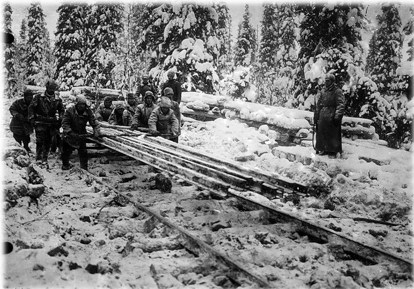
Хибиногорск – 1930-е годы. Строительство ж/д от разъезда Белый до Кукисвумчоррского месторождения.

Уголовно-исполнительная система Мурманской области берёт своё начало с 30-х годов прошлого столетия. Первоначально она представляла собой систему исправительно-трудовых лагерей (ИТЛ) на Кольском полуострове. Создание ИТЛ неразрывно связано с освоением северного края в период индустриализации СССР. Заключённые 23-х ИТЛ в период с 30-х по 60-е годы XX века активно участвовали в создании всей производственной базы Кольского края.