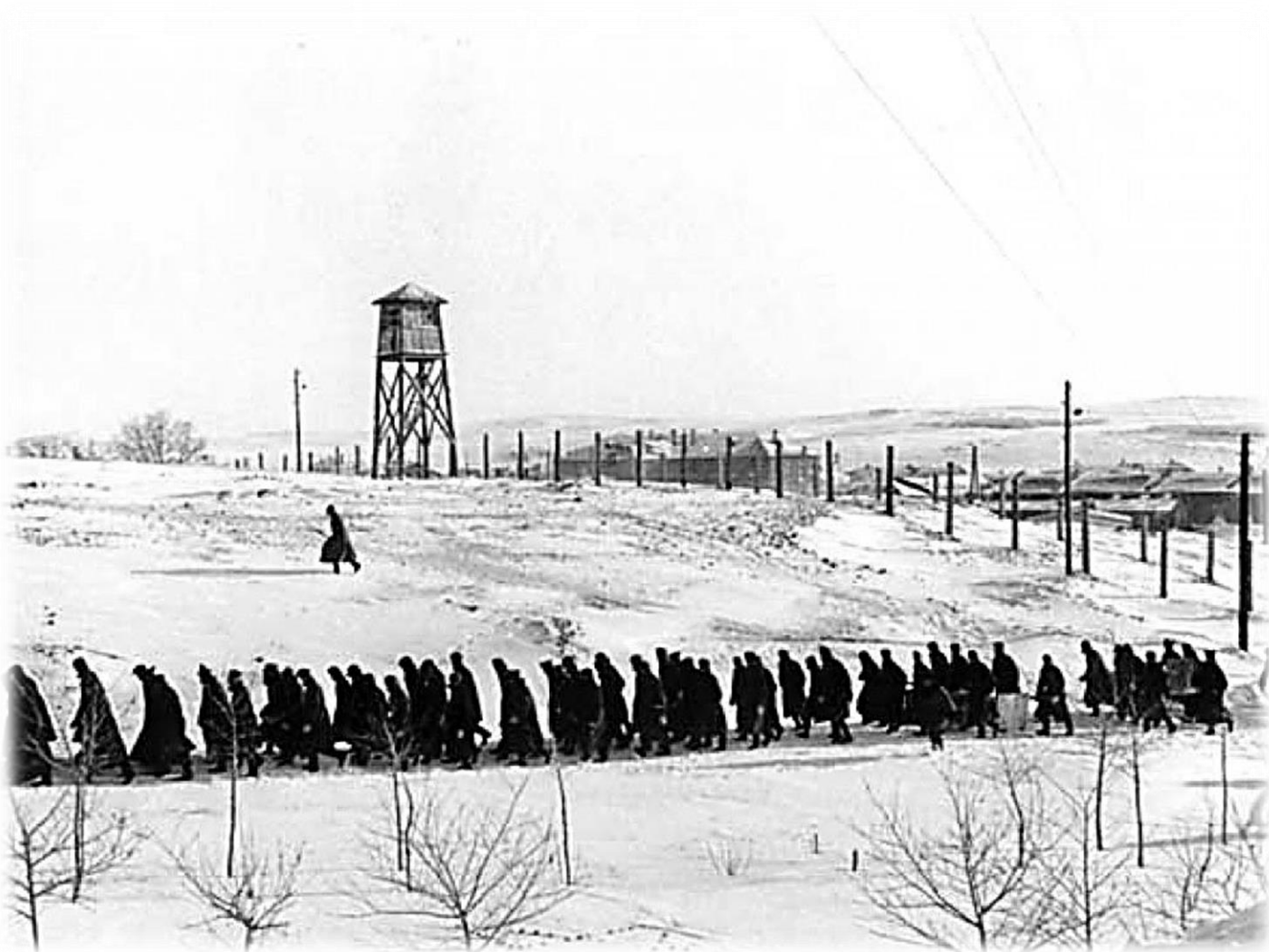
Кандалакша. Колонна ЗК возвращается с работ в зону.

История Советского государства начала второй половины XX столетия характеризуется глубокими демократическими процессами, связанными с осуждением государственной политики и практики незаконных массовых репрессий в сфере уголовных наказаний и их реализации на протяжении 30-х - начала 50-х годов. В конце 50-х годов ликвидируются исправительно-трудовые лагеря - становой хребет системы массового использования труда заключенных.