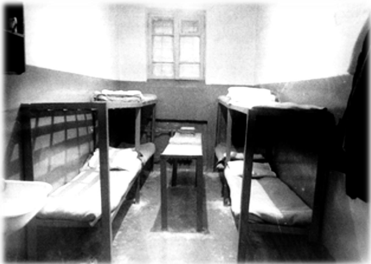
Типовая камера в СИЗО СССР (80-е годы)

Спецконтингент учреждений активно участвовал в выполнении госзаказа по выпуску товаров народного потребления. Выпуск товарной продукции за 9 месяцев 1990 года при плане в 56000 тыс. руб. составлял 64720 тыс. руб. (115,6%), а средний процент выполнения норм выработки составлял 124,2%.