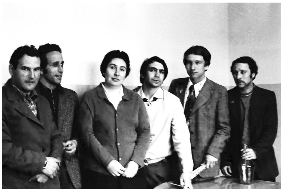
Редакция «Рудного Ковдора»