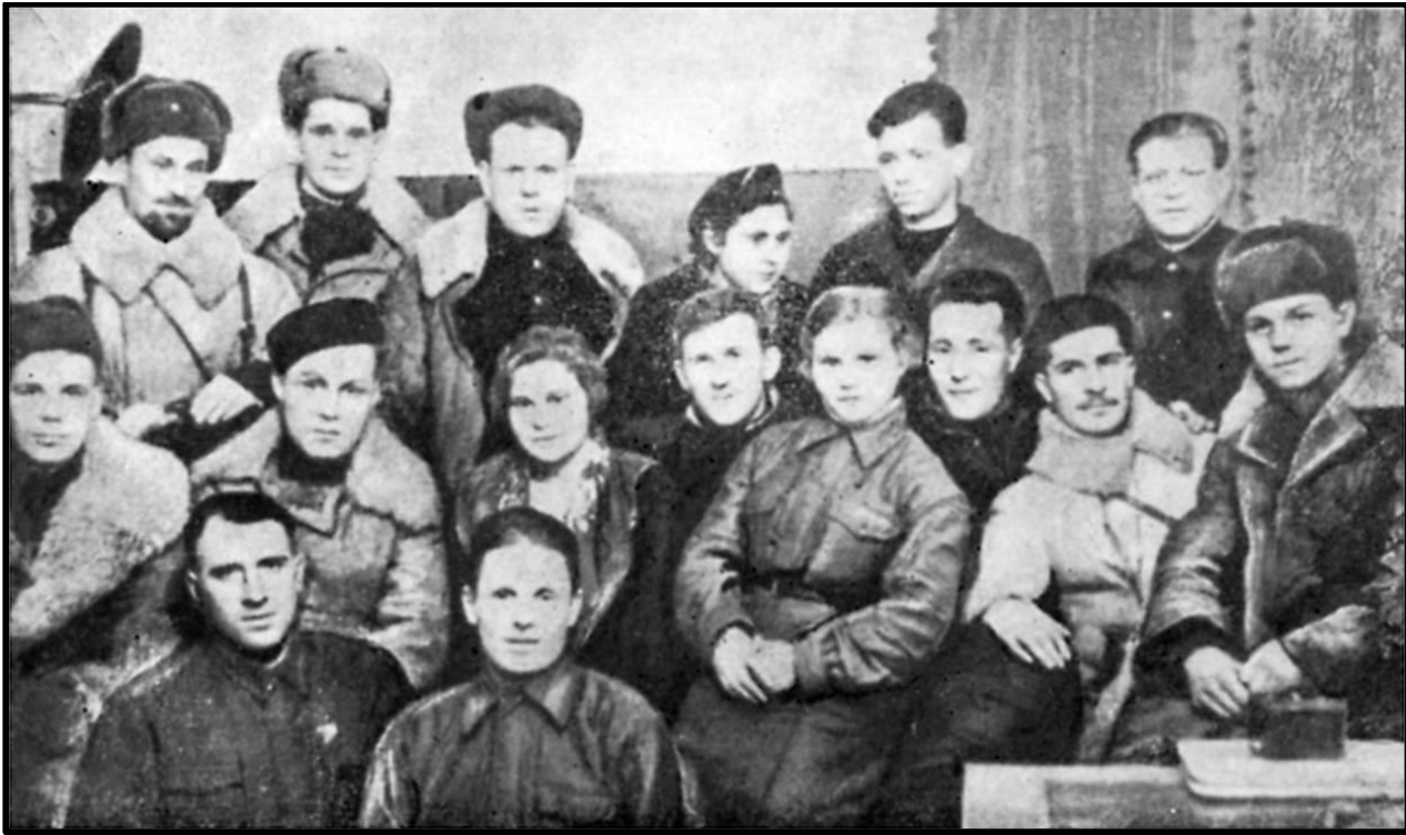
Группа партизан из отряда «Большевик Заполярья»