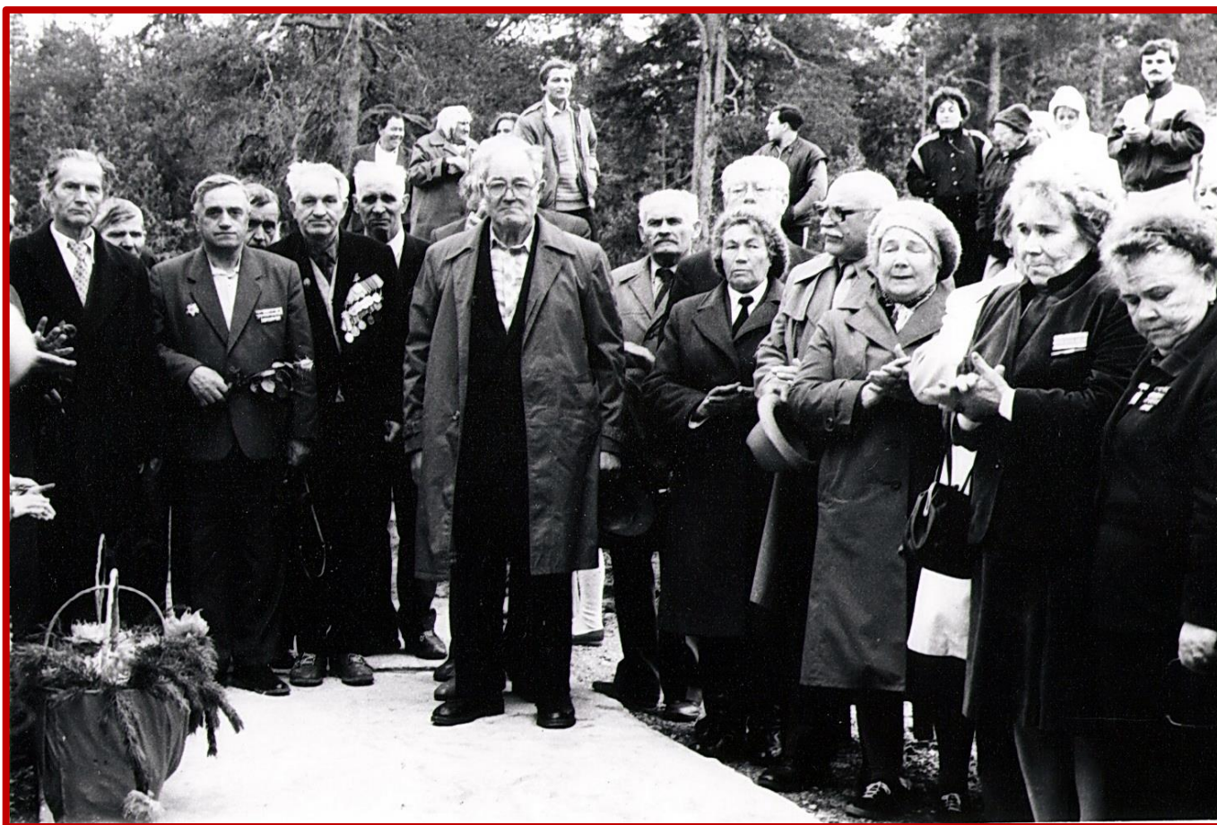
1980 год. Ветераны на открытии мемориала «Шуми-городок»