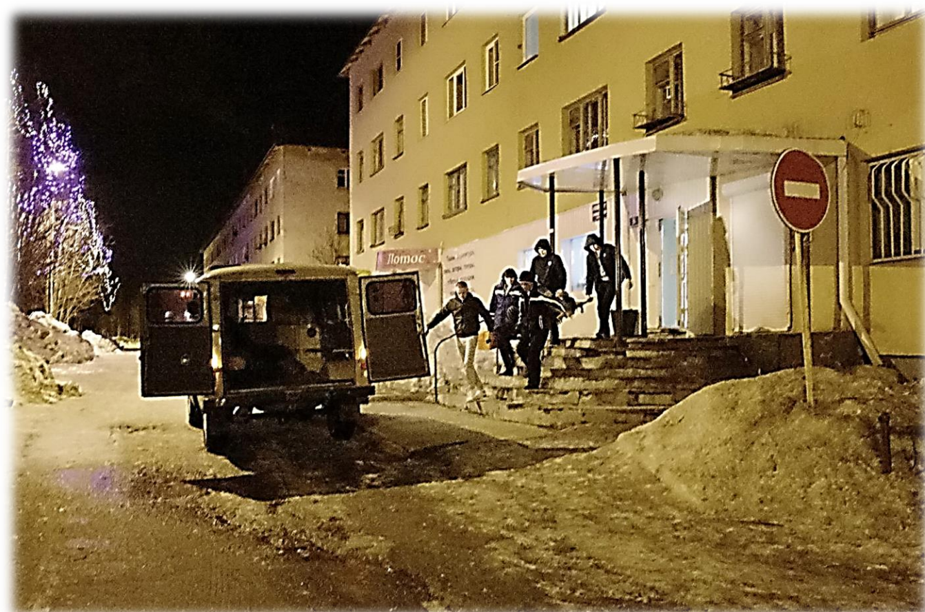
Транспортировка в больницу Ковдора мужчины в нетрезвом состоянии, спавшего на улице. Помимо холода, основная опасность для людей в состоянии опьянения — черепно-мозговые травмы.