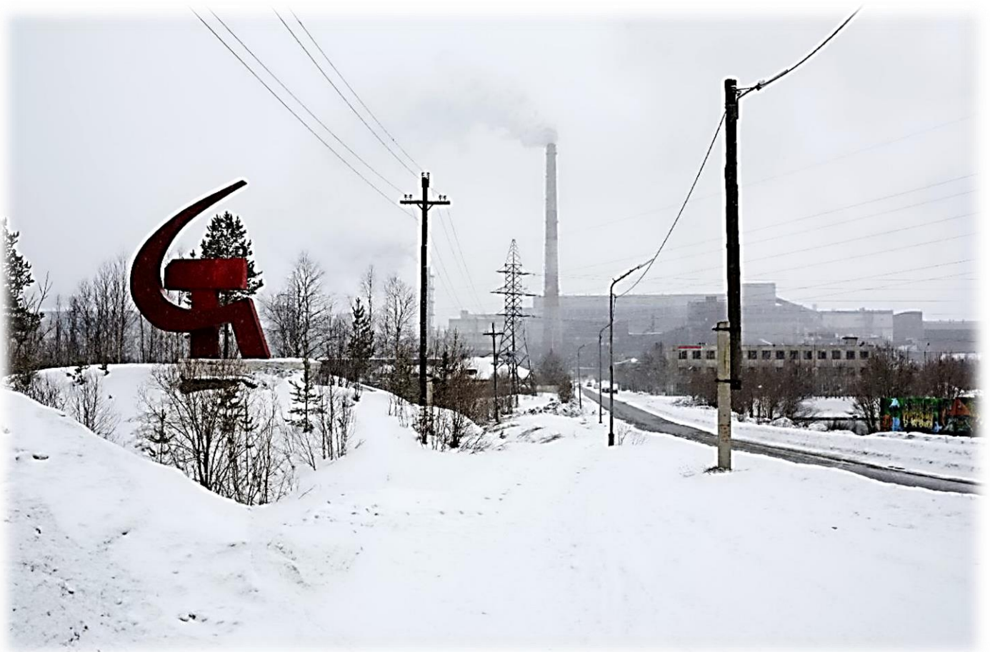
Вид на горно-обогатительный комбинат, градообразующее предприятие Ковдора. С 2001 года Ковдорский ГОК состоит в компании «Еврохим», крупнейшем химическом холдинге России.