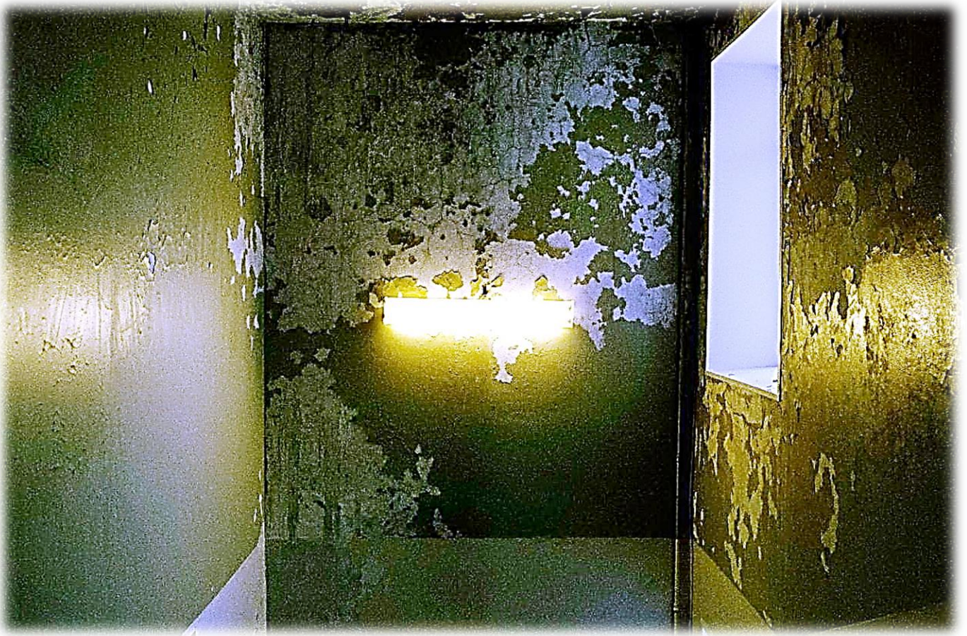
Вид на лестничный пролет в центральной больнице. Ковдор включен в перечень моногородов, находящихся в сложном социально-экономическом положении.