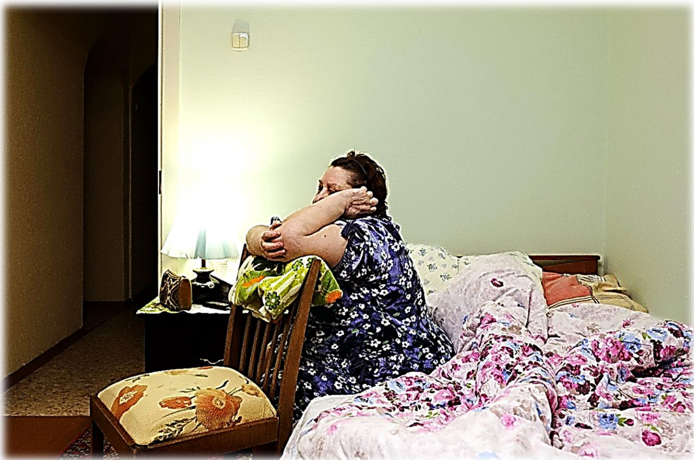
Пациентка обратилась в скорую с жалобой на приступ астмы.