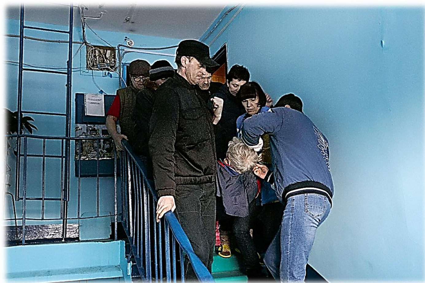
Фельдшер, родственники и знакомые переносят по лестнице больного в мягких носилках. Часто возникают ситуации, когда приходится искать помощи с переноской больных у прохожих на улице.