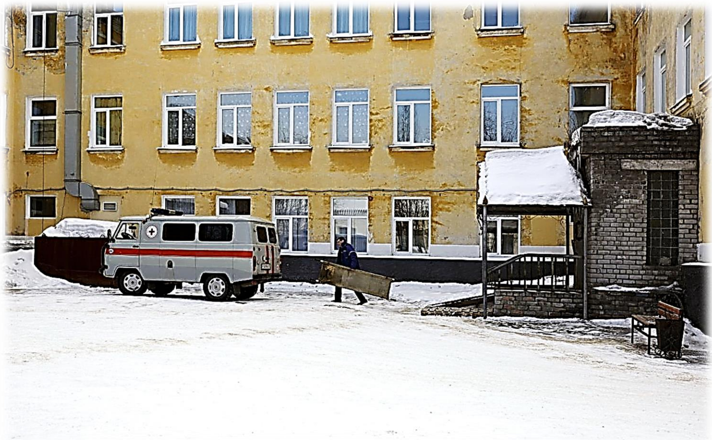
Вид на главное здание больницы Ковдора. Водитель несет носилки к машине.