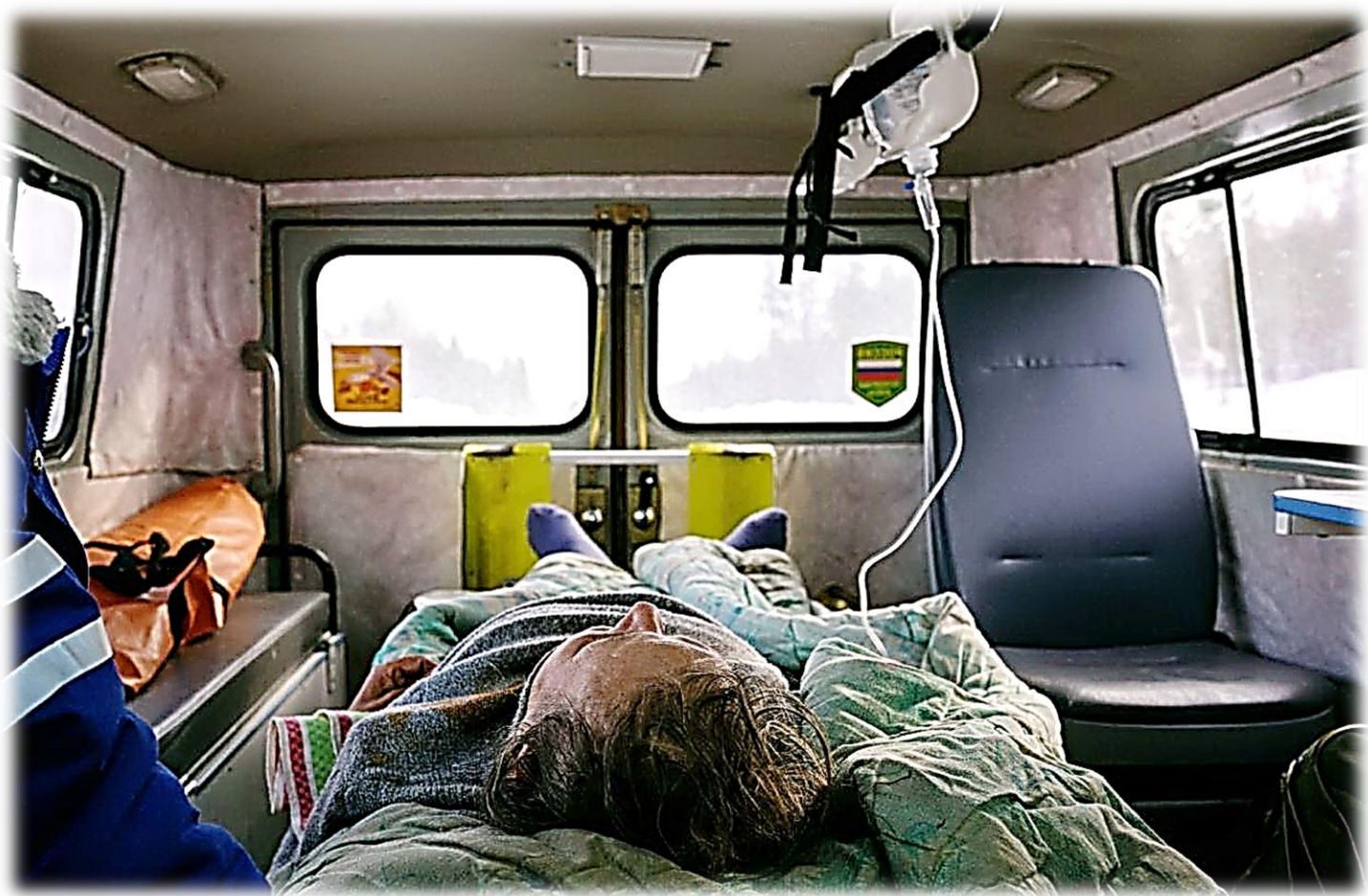
Транспортировка пациентки из поселка Лейпи в больницу города Ковдора.