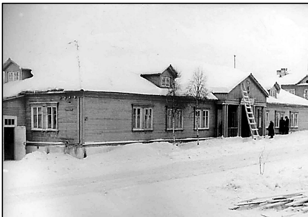
Первая поселковая больница