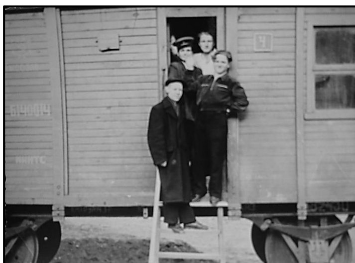
Жилой вагончик на станции Ковдор