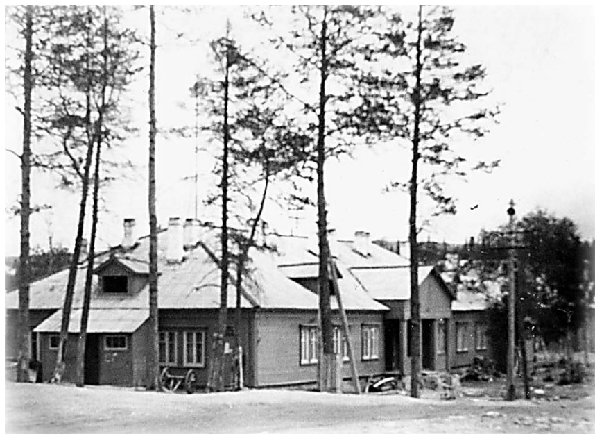
Улица Ленина (117 км). 1954 г.