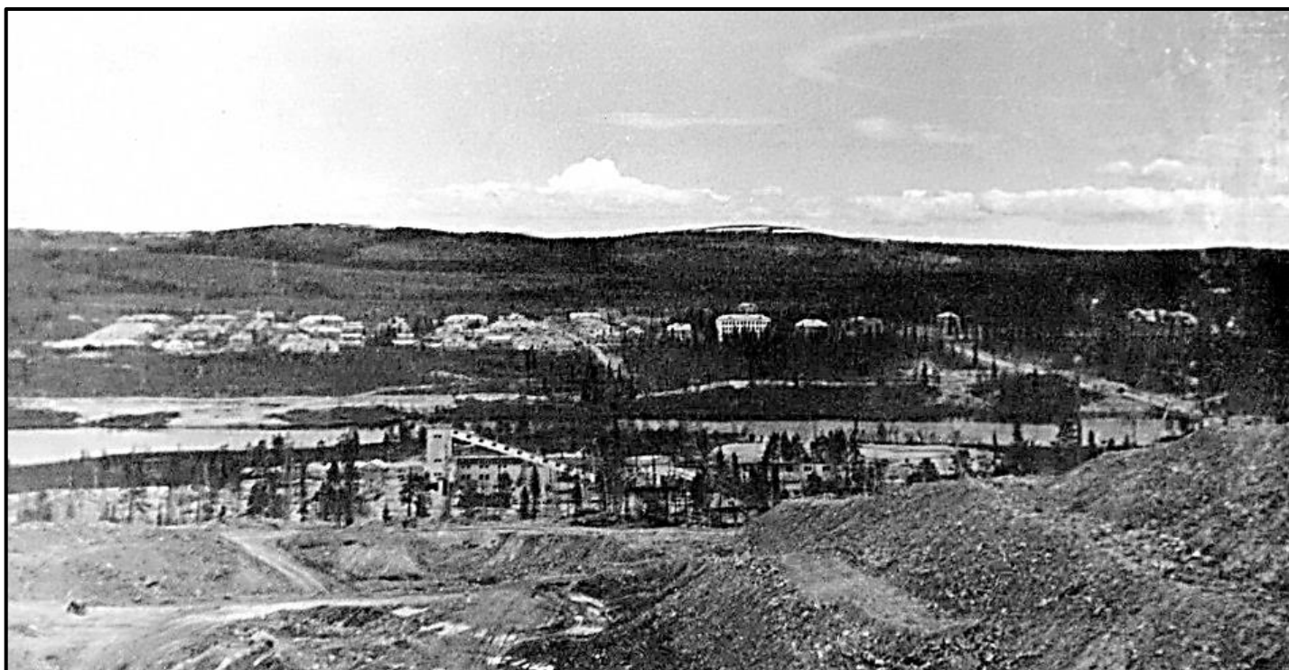
«Ковдор в 1957 году»