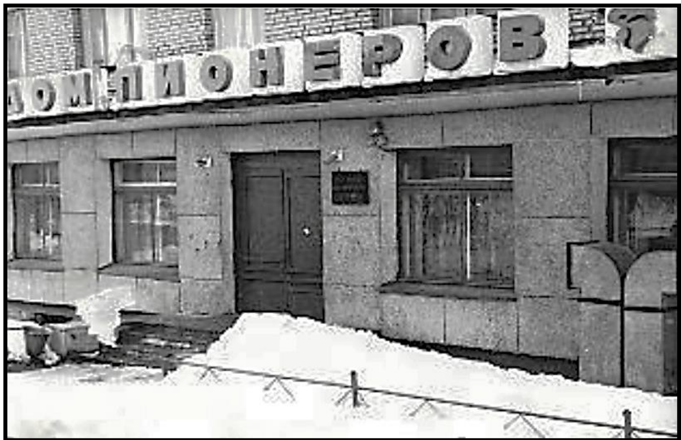
Дом пионеров на ул. Ленина, 13

В октябре 1972 года в Ковдоре, в двухкомнатной квартире по улице Слюдяной дом 7, собирались мальчишки и девчонки для творческого общения. Это и стало первой локацией ковдорского Дома пионеров.