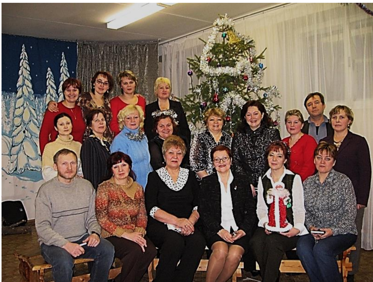
Коллектив Центра детского и юношеского творчества