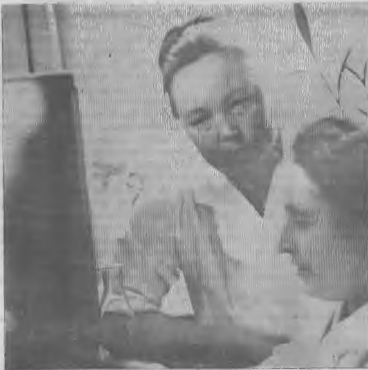
Фото и текст нашего внештатного корреспондента В. Спиридонова.