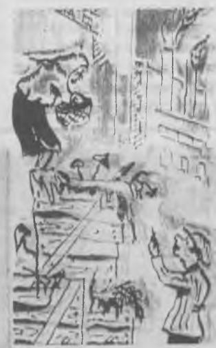
— Вам, что, в лесу грибов мало? — Да, нет, я просто хочу узнать, какое оборудование здесь хранится. Рисунок А. НИКОЛАЕВА.

Итак, если вы прочтете своему ребенку веселые стихи про даму, которая сдавала в багаж диван, чемодан и так далее, то не забудьте объяснить ему, что это тетка чужая. У нас на комбинате пока не работает.