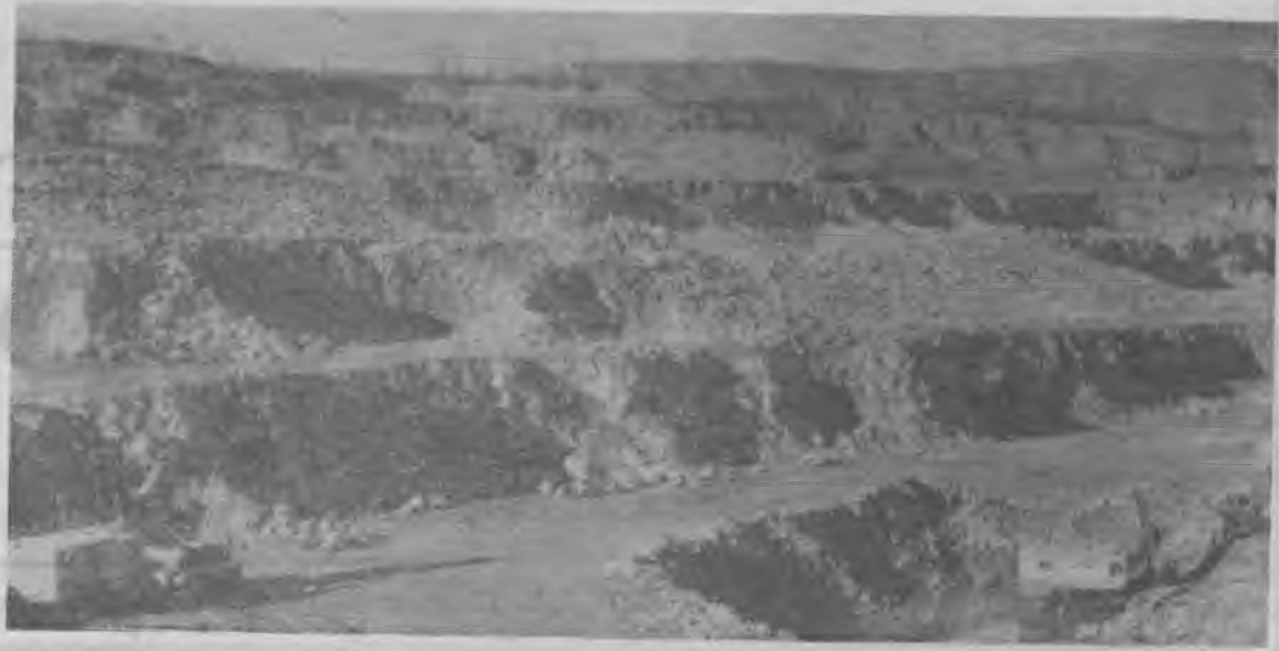
Общий вид рудника «Железный».