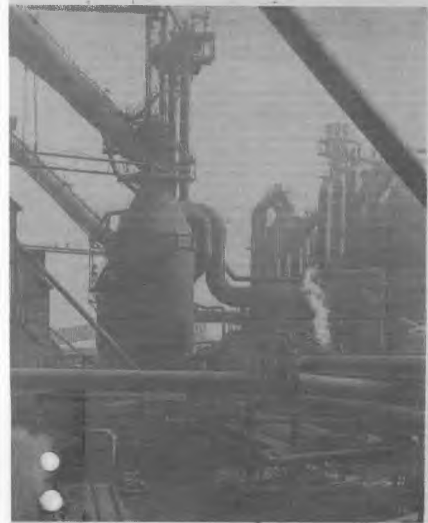
Доменный цех Череповецкого металлургического завода.