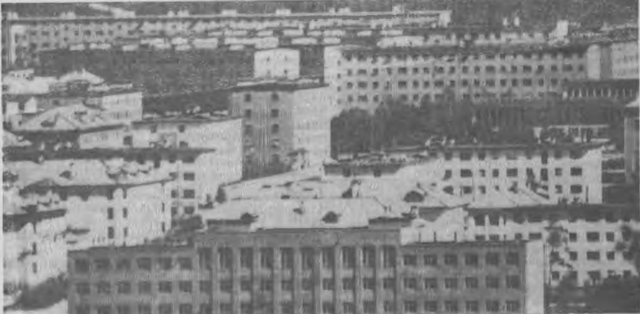
1973 год. Этажи Ковдора.