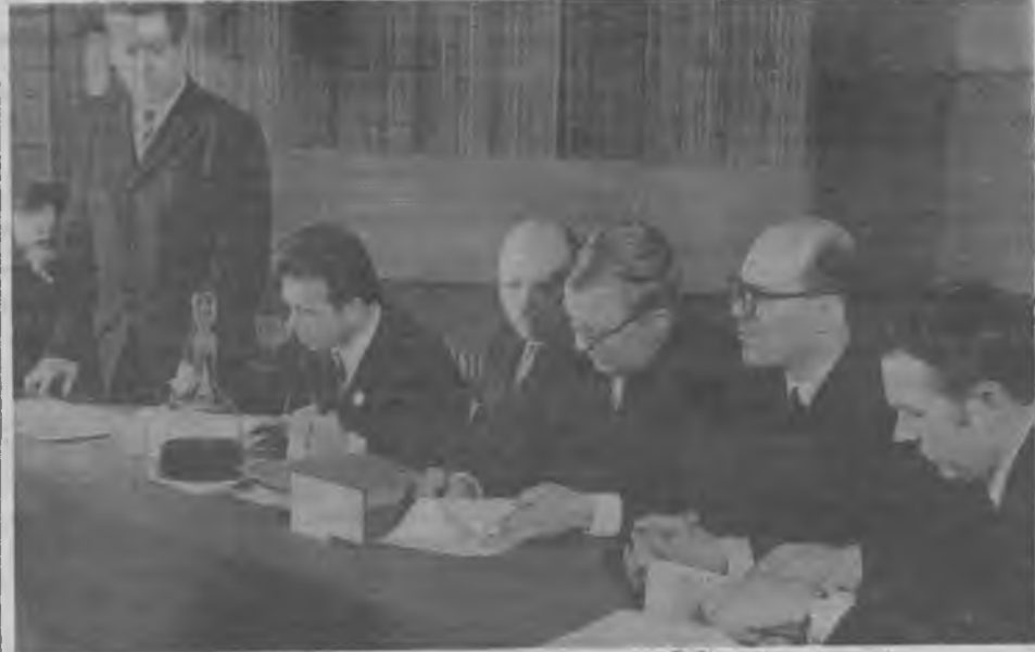
Момент подписания социалистических обязательств между участниками межотраслевого соревнования.