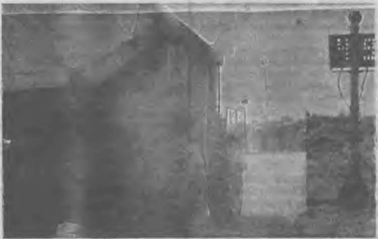
БелАЗ, не останавливаясь, проходит по тензометрическим весам. Его точный вес в тоннах высвечивается на световом табло.