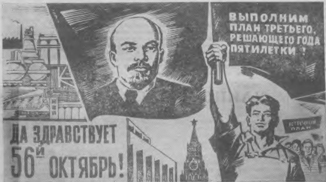
Плакат издательства «Московская правда»