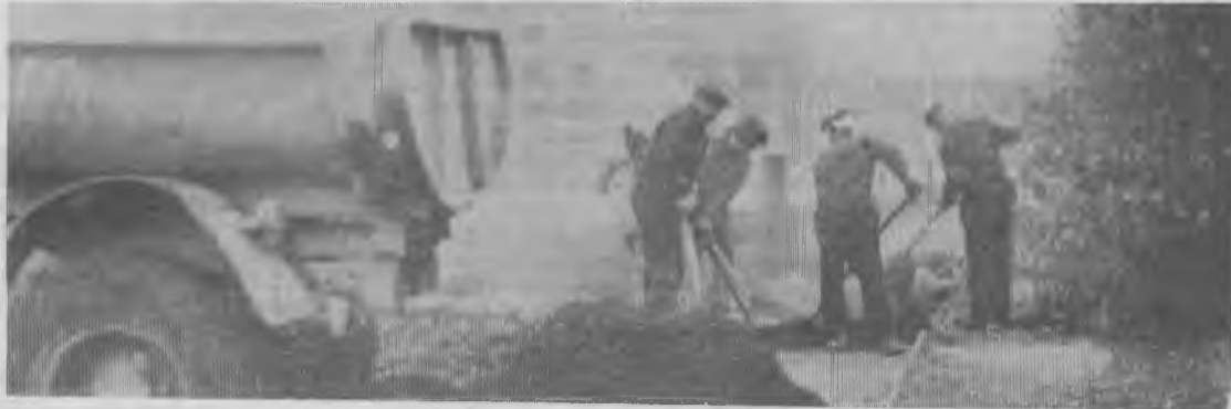
На снимке: Укладка асфальта на улице Кошица. Здесь ведет работы трест «Ковдорстрой» — единственная пока организация в городе, которая откликнулась на призыв Ковдорского ГОКа участвовать в благоустройстве Ковдора.

И еще одно «если». Если в осуществлении этой мечты будут заинтересованы все предприятия города. Т. ГОРСКАЯ.