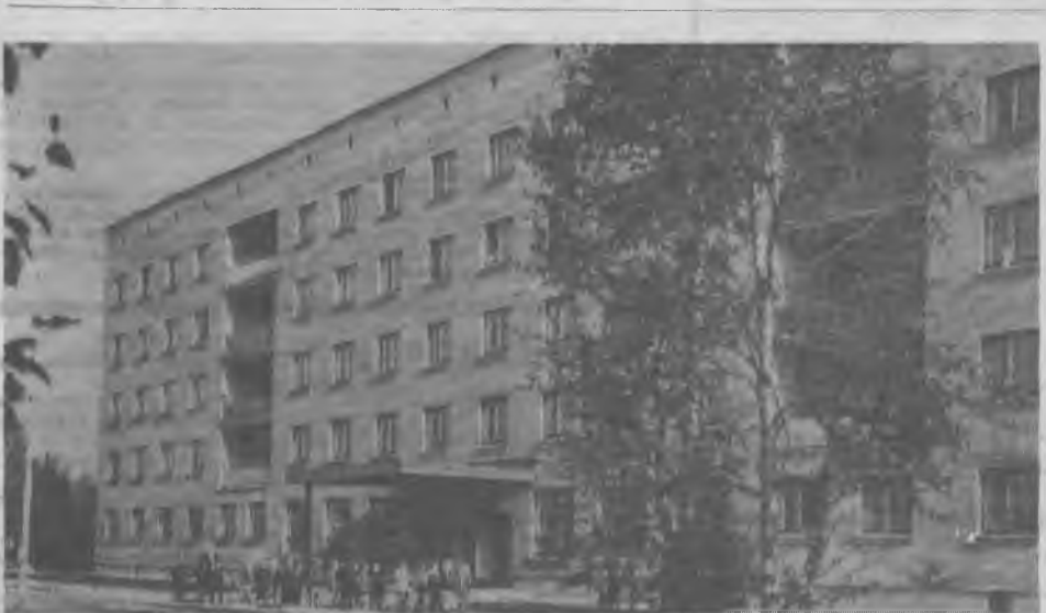
Полярный переулоч, 12 — адрес этого красивого общежития. На днях в нем справили новоселье 320 рабочих Ковдорского ГОКа, ремонтно-строительного управления, шахтопроходки.