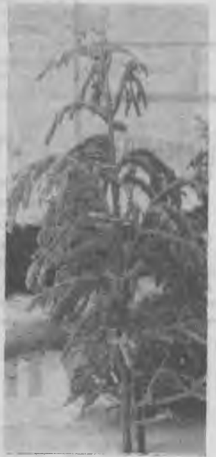
Гирлянды зимы.

И как наглядное тому подтверждение — стенд-карта, где от маленькой точки, обозначающей Ковдор, тянутся красивые нити — узы дружбы, соединяющие юных КИДовцев 17-й школы с их сверстниками из Чехословакии, Болгарии, ГДР, Поль-