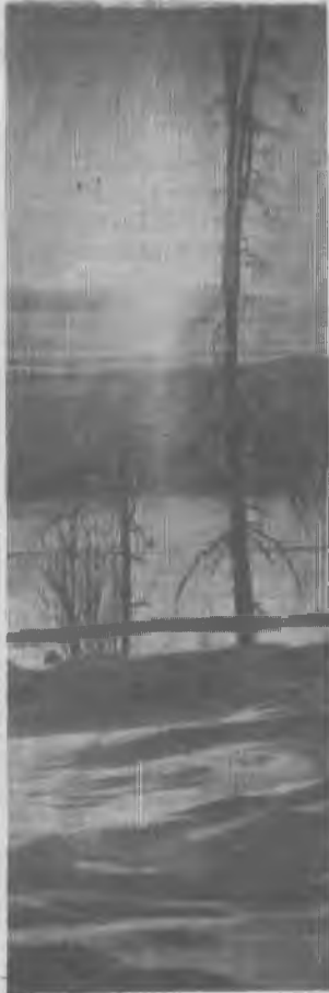
Последний луч.