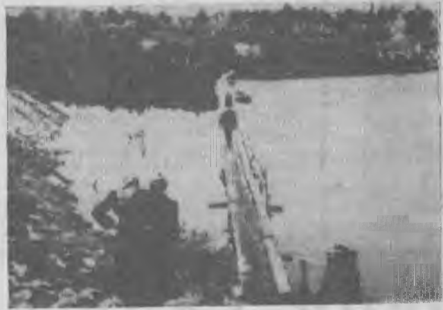
1954 год. Переход через озеро. На этом месте сейчас дамба.

«РУДНЫЙ КОВДОР» ПЯТНИЦА, 2 ноября 1973 года