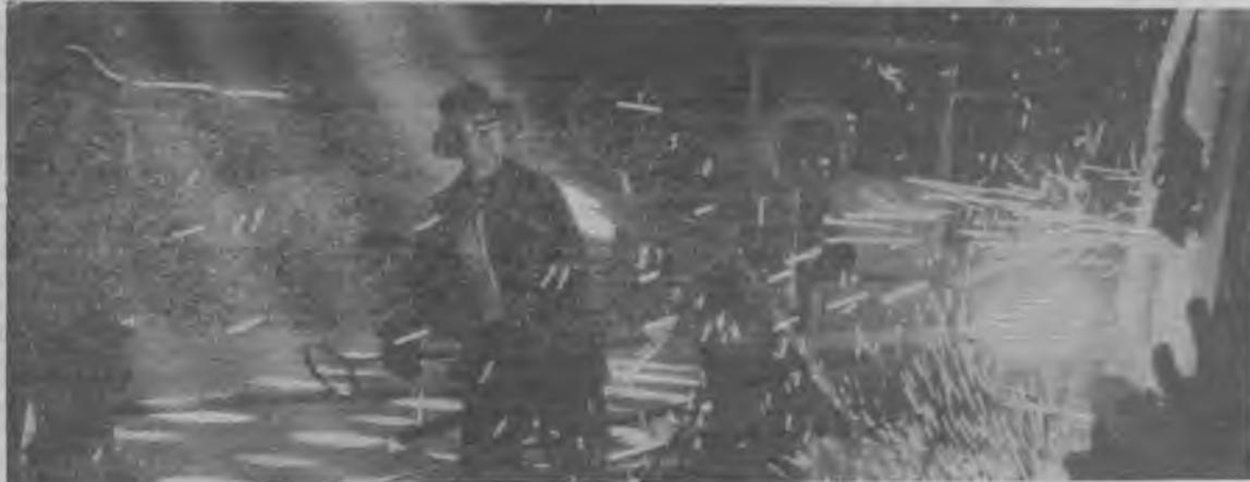
В электросталеплавильном цеху.