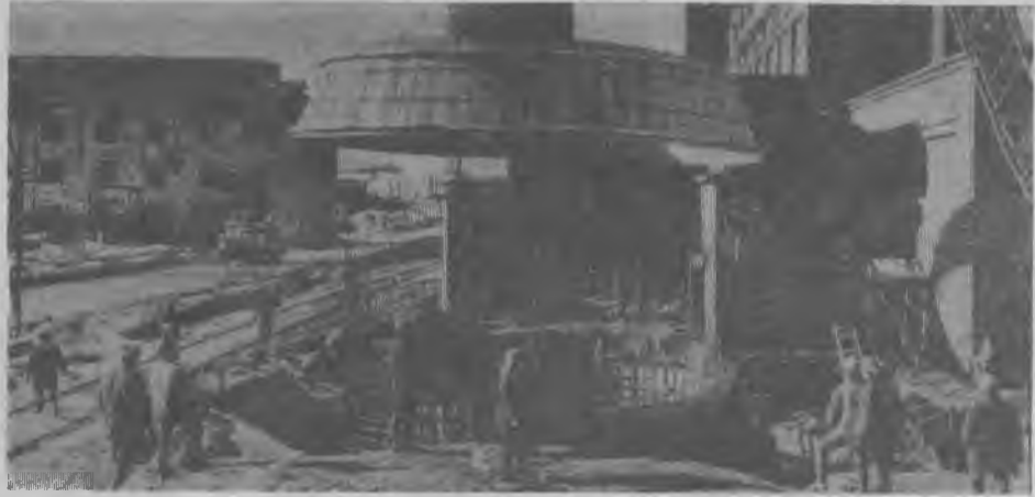
Момент установки цельномонтированного конуса опалуки для бетонирования фундамента дымовой трубы ТЭЦ.