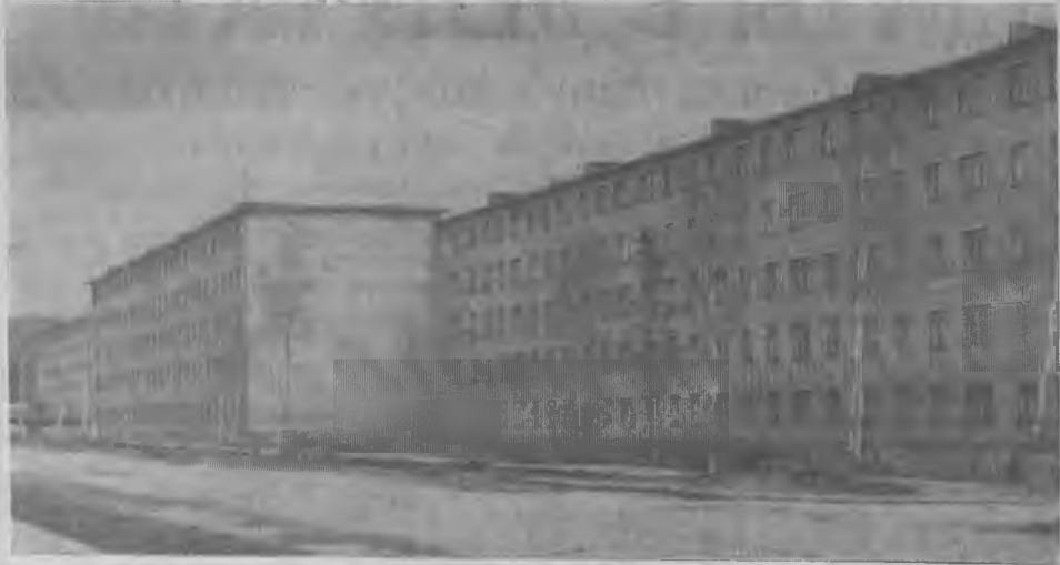
С 1971 по 1974 год в Ковдоре и пригородной зоне построено 23 пятиэтажных жилых дома. Новоселы за четыре года получили 1.630 квартир. Примечательно, что в 1974 году новоселами стали 588 семей.

По плану 1975 года намечается построить еще 6 домов, значит, еще 400 семей справят новоселье.