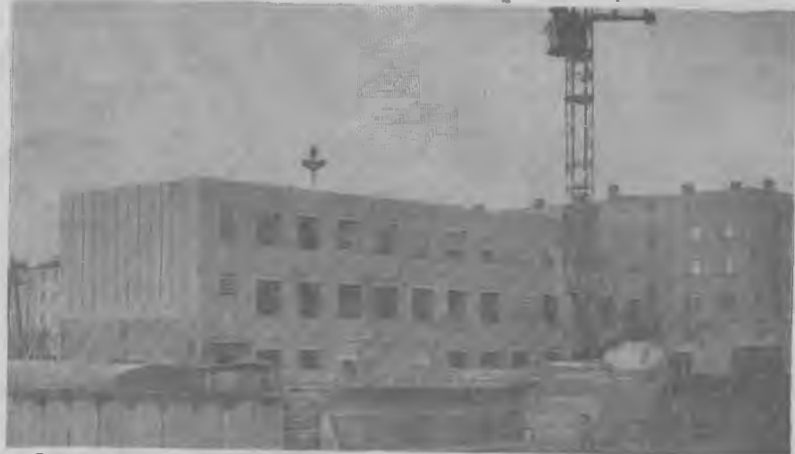
Одна из городских новостроек — Дом связи. В нем разместятся АТС на 1000 номеров, городской почтамт, переговорный пункт.

За последний год объем реализации бытовых услуг по комбинату бытового обслуживания вырос со 186,8 тысячи рублей до 219,1 тысячи. И если на 1 января 1973 года был 101 вид услуг, оказываемых комбинатом населению, то на 1 января 1975 года их стало 153.