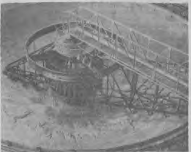
Здесь, в 18-метровых сгустителях, ковдорский апатит окончательно доводится до кондиции.