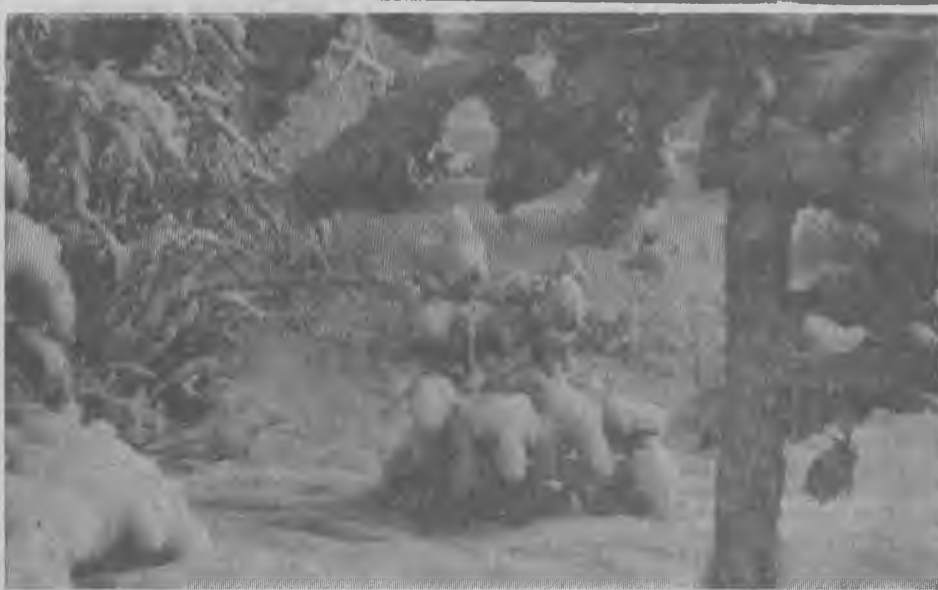
Взгляни на январскую эту красу — Увидишь, что грусти не место. И сосны стоят в онемевшем лесу, Как в белых нарядах невесты.

воспитатель общежития, член общественной комиссии.