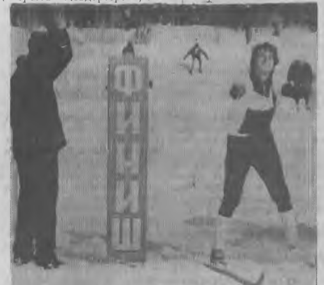
Редактор Я. М. МАХЛИН.

Обладателем главного приза «Рудного Ковдора» стала команда Ковдорского ГОКа. На втором месте в первой группе — команда треста «Ковдорстрой», и