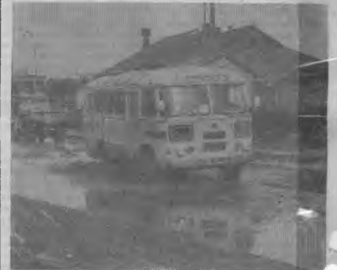
Через пару метров автобус уподобится мотоамфибии, по самый радиатор зарывшись в воду. Так было у хлебозавода. Сейчас так у ворот «Металлургпрокат-монтажа».

га» грейдером. Теперь очередь за второй. И грейдером «проутюжить» названный в статье участок. Иги тоже бы очень нужны.