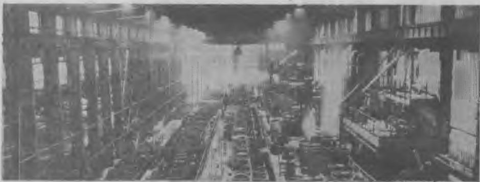
АБОФ. Пролет флотации.