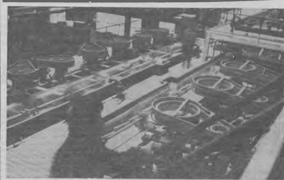
На снимке: участок флотации апатито-бадделитовой фабрики. Флотомашин.

В. ХАБАРОВ, заместитель главного механика комбината.