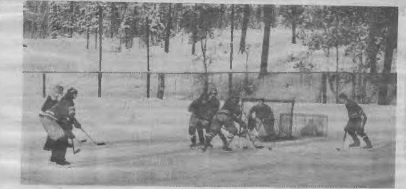
В воскресенье состоялась встреча по хоккею между командами ветера-нов и юношей Ковдорского ГОКа. Она проходила в интересной борьбе. До-статочно сказать, что первый период выиграли ветераны со счетом 2:1. Но молодежь все же взяла свое, и окончательный итог встречи 8:4 в пользу юношей.