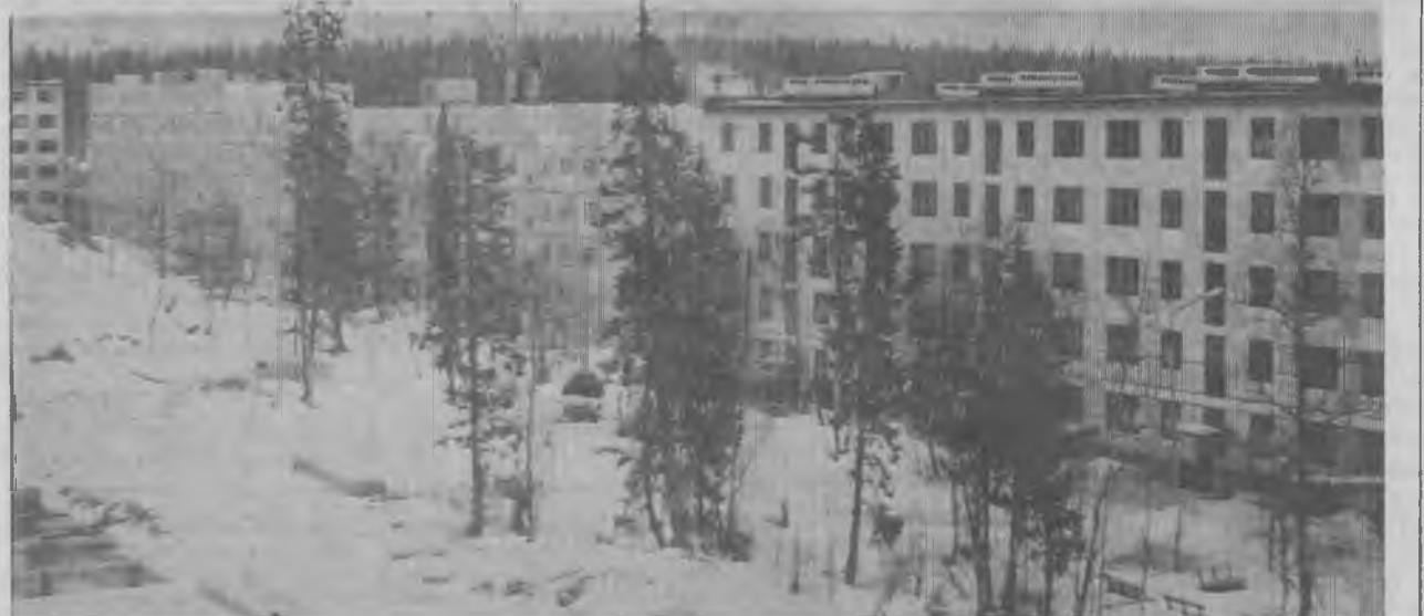
Два года назад на этом месте только появились первые строительные машины. Сейчас здесь вырос целый микрорайон. В 1973 году по адресу улица Зеленая поселилось 99 семей ковдорчан, а в 1974 году — 238 семей. Строительство жилых домов на Зеленой продолжается.

гицидам — 100 килограммов. Ученые произведут лабораторные исследования с тем, чтобы окончательно определить потребители ковдорского сырья.