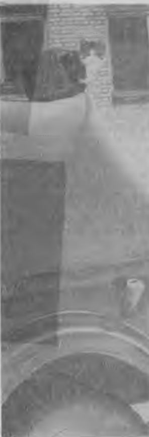
Пока шофер дремлет...