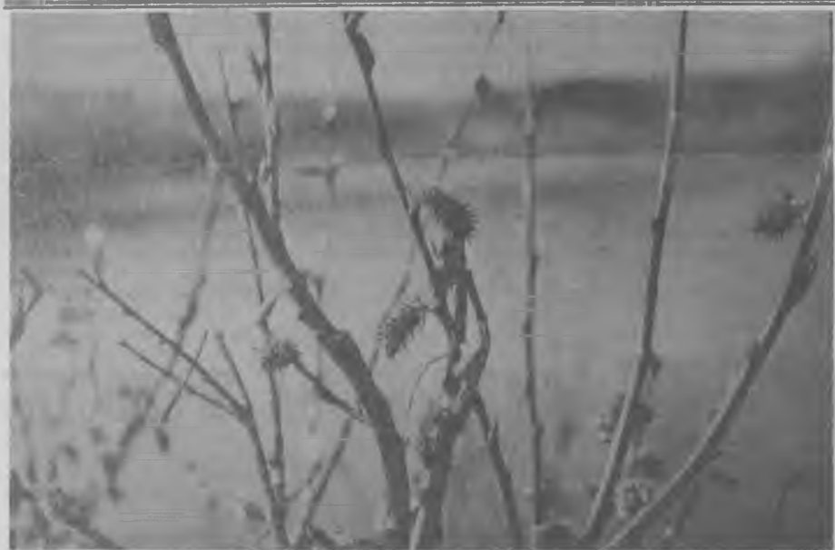
... Маленький листик в своей колыбели Спит и губами чмокает.