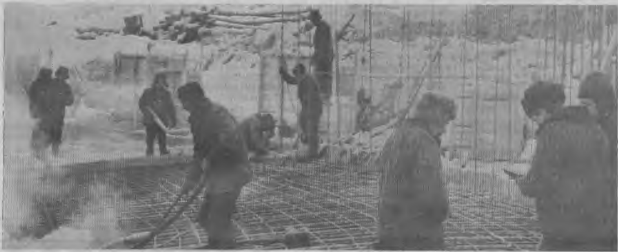
◆ ПОСТ НАРОДНОГО КОНТРОЛЯ ◆