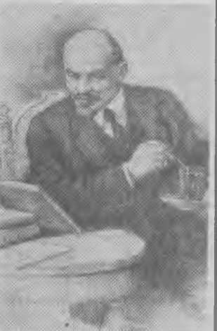
105-я ГОДОВЩИНА СО ДНЯ РОЖДЕНИЯ В. И. ЛЕНИНА «В. И. Ленин за чтением книги» — карандашный рисунок народного художника РСФСР П. В. Васильева (1968 г.).