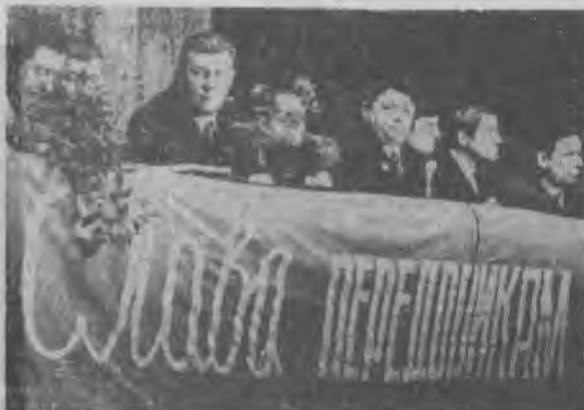
Слет передовиков производства Ковдорского ГОКа.

Комсомольские собрания уже состоялись во многих цехах, отделах, службах Ковдорского горно-обогатительного комбината: в цехе подготовки производства, в электроцехе, на всех участках железорудной обогатительной фабрики, в отделах технического контроля и жилищно-коммунальном, на ремонтно-строительном участке. Комсомольцы и молодежь отдела рабочего снабжения на своем собрании приняли резолюцию: встать на месячную трудовую вахту под девизом «За себя и за того парня». А коллектив комсомольско-молодежной смены участка обогащения железорудной обогатительной фабрики обязался выполнить полугодовые обязательства ко Дню Праздника Победы.