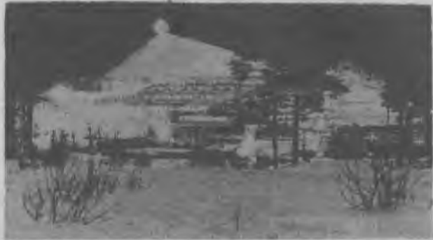
Апатито-бадделейитовая фабрика. В апреле должны быть отгружены потребителям первые тысячи тонн ковдорского апатита.

ИТР участков лично отвечают за уборку металла со взрывных блоков.