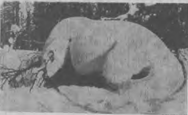
Белый медведь?

Все это мы бы написали автору анонимки в личном послании. Но поскольку адрес неизвестен — решили прибегнуть к открытому письму.