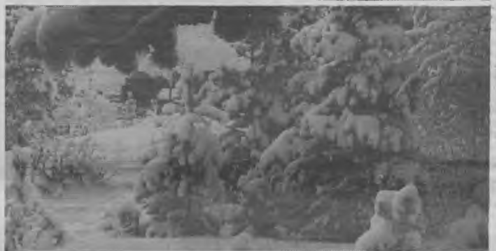
В теплые меха из горностая нарядилась каждая сосна...