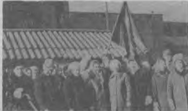
Работа начиналась с митинга.